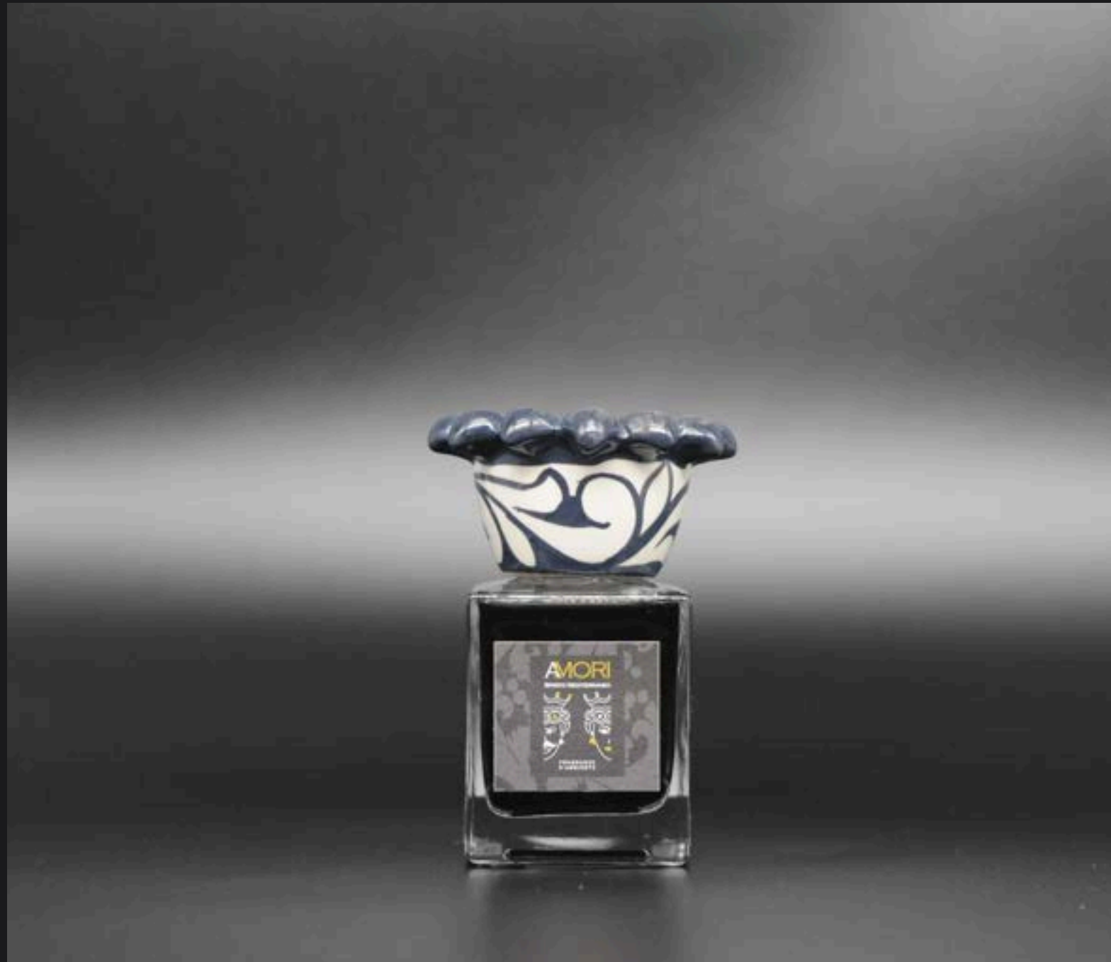
Flacone ml 100 Collare Corona