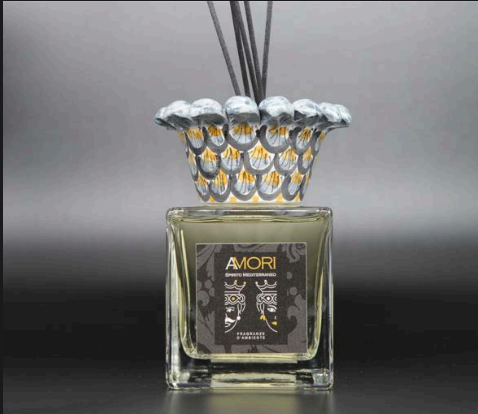
Flacone ml 500 Collare Corona