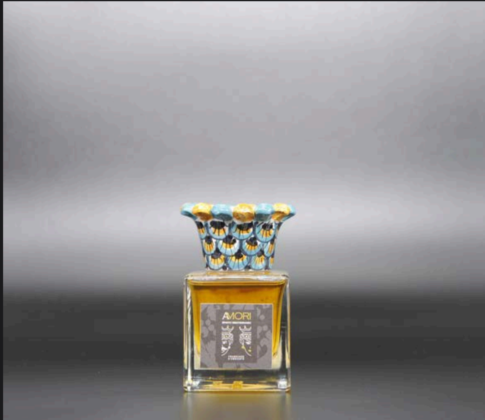
Flacone ml 100 Collare Corona