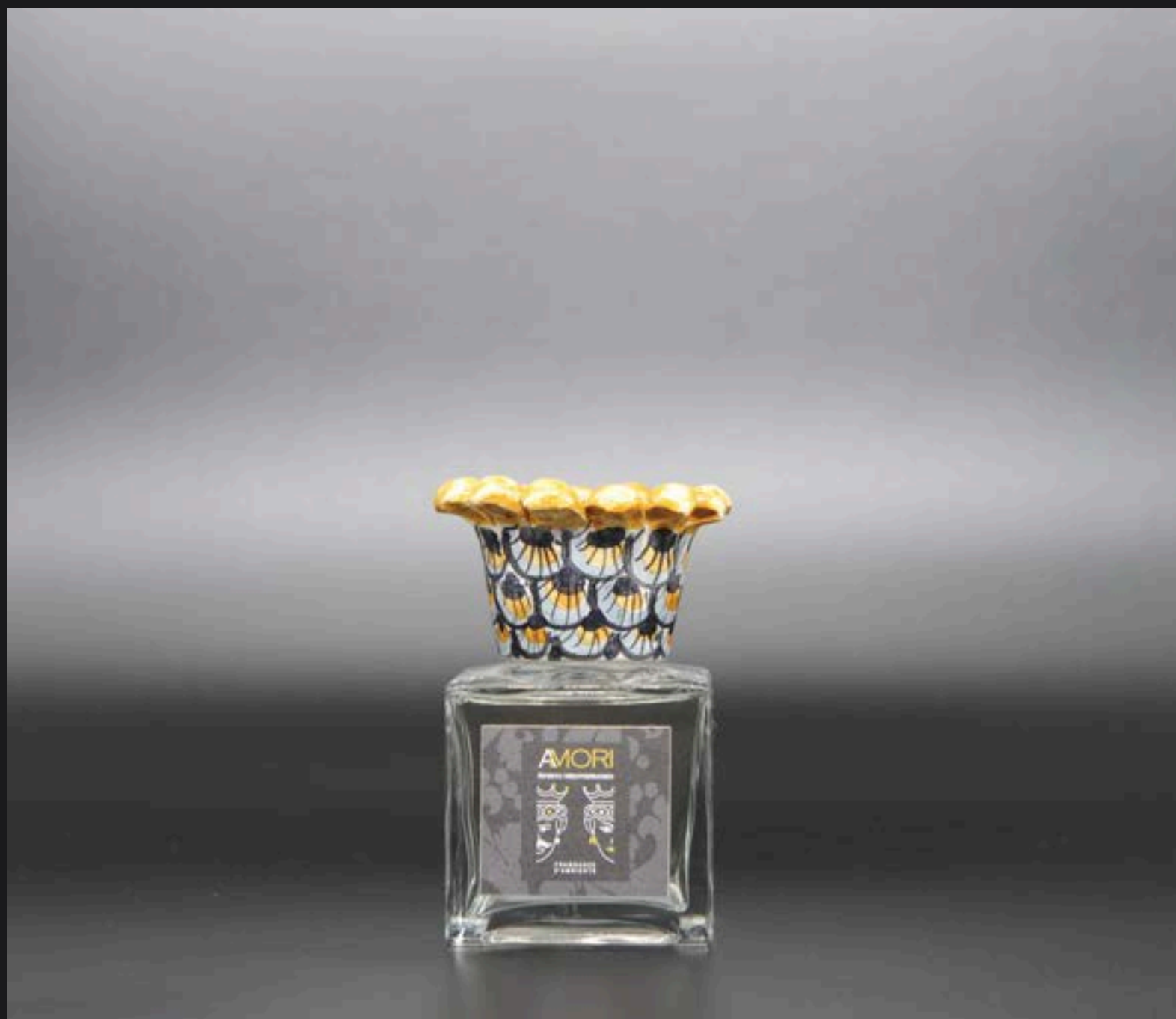
Flacone ml 100 Collare Corona