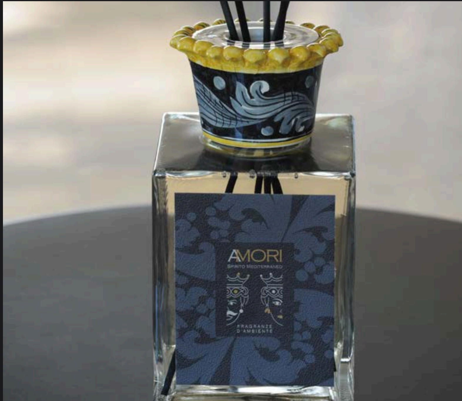
Flacone ml 2500 Collare Corona