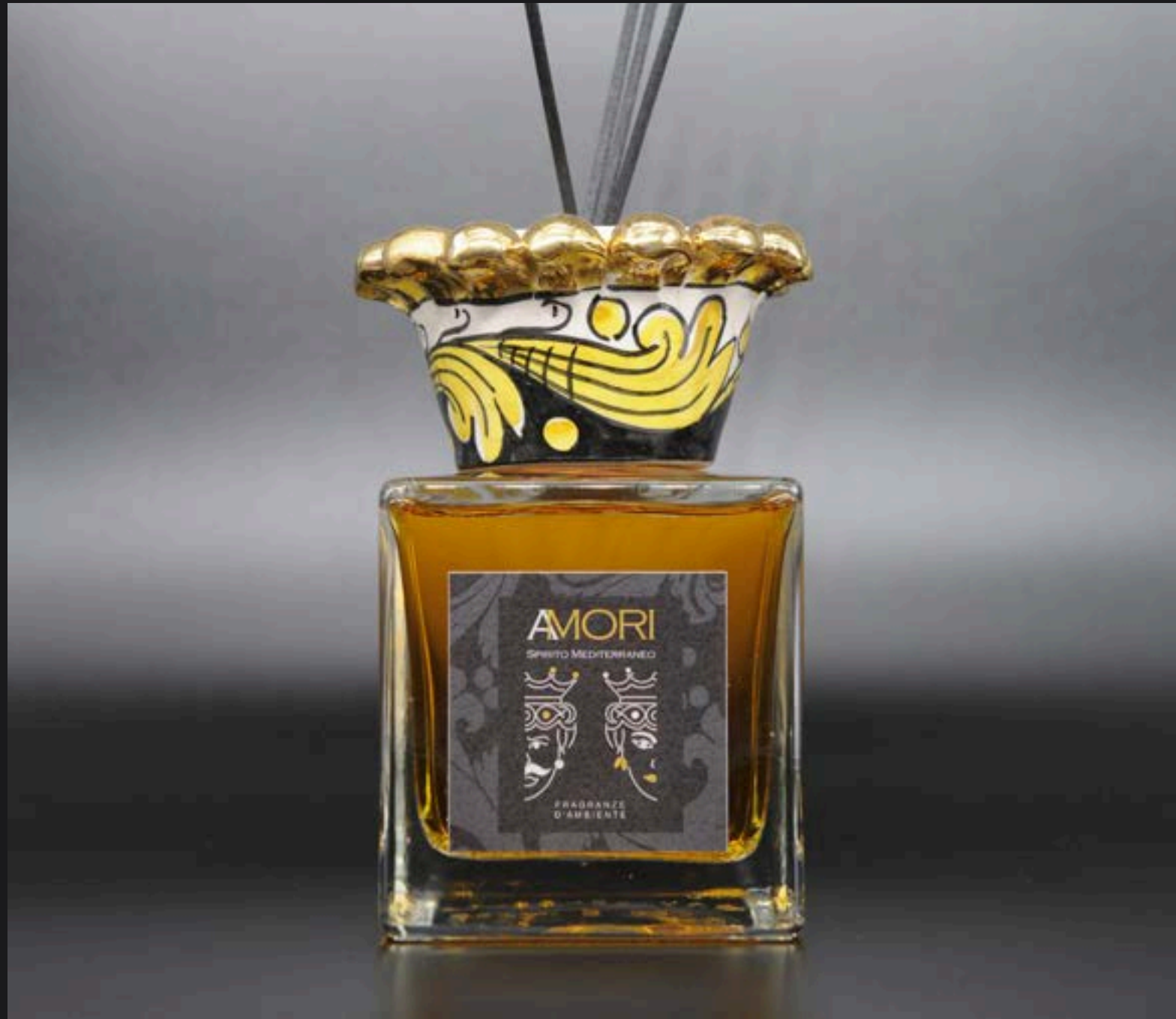
Flacone ml 500 Collare Corona