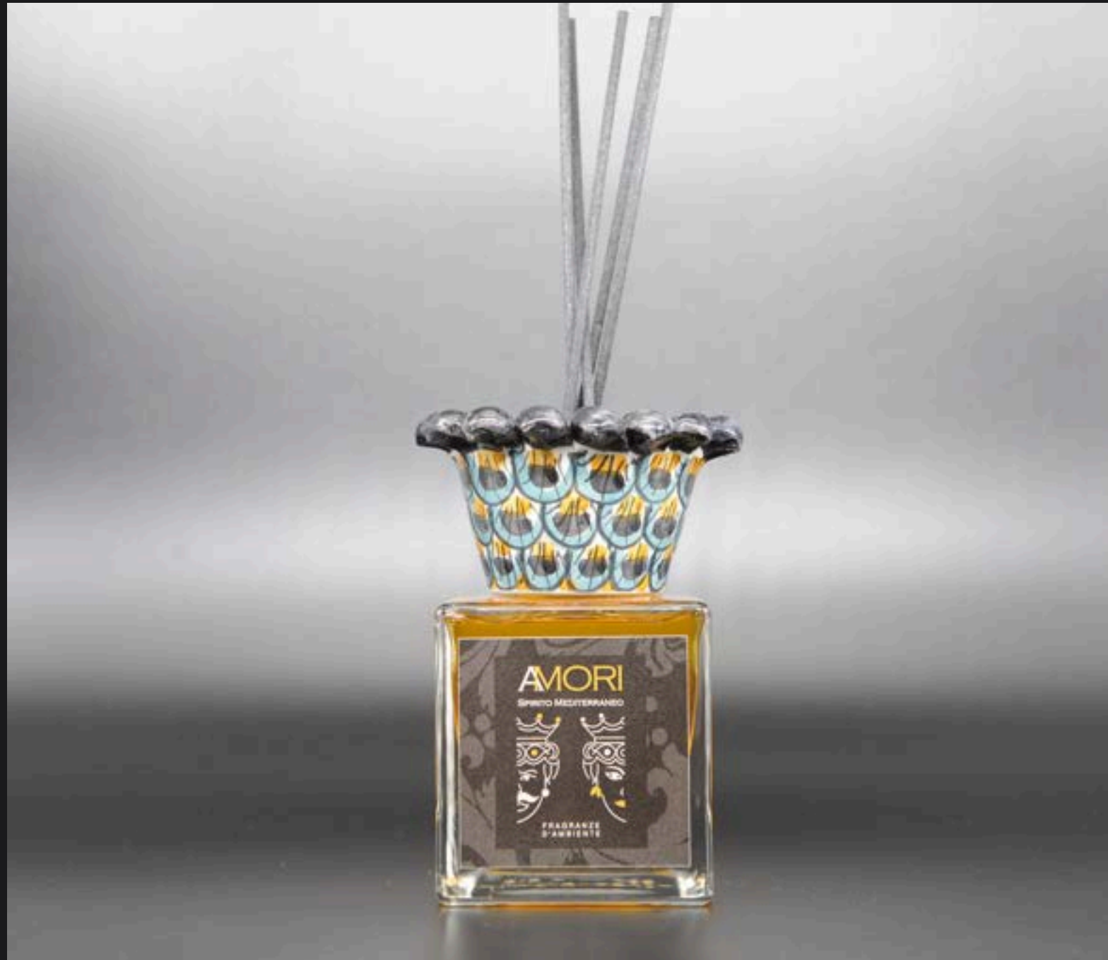
Flacone ml 200 Collare Corona