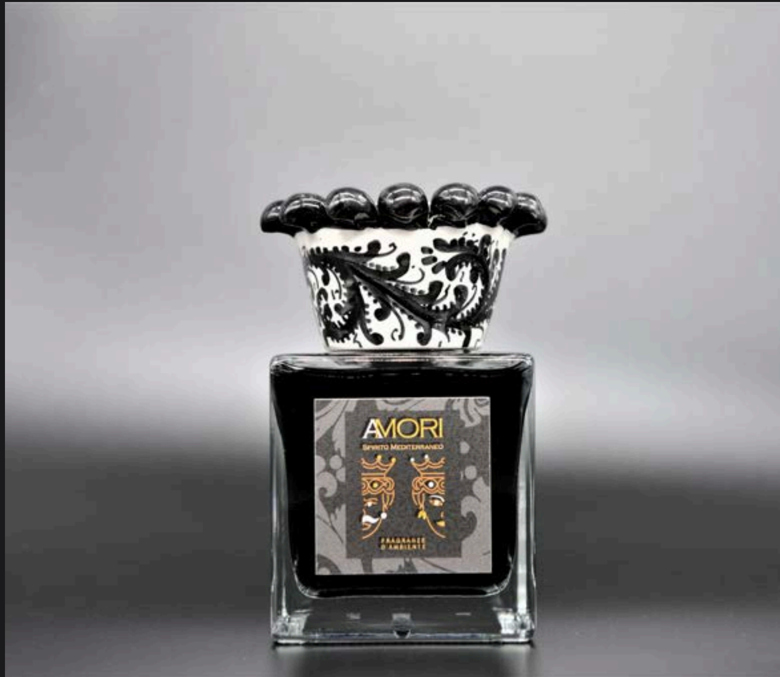
Flacone ml 500 Collare Corona