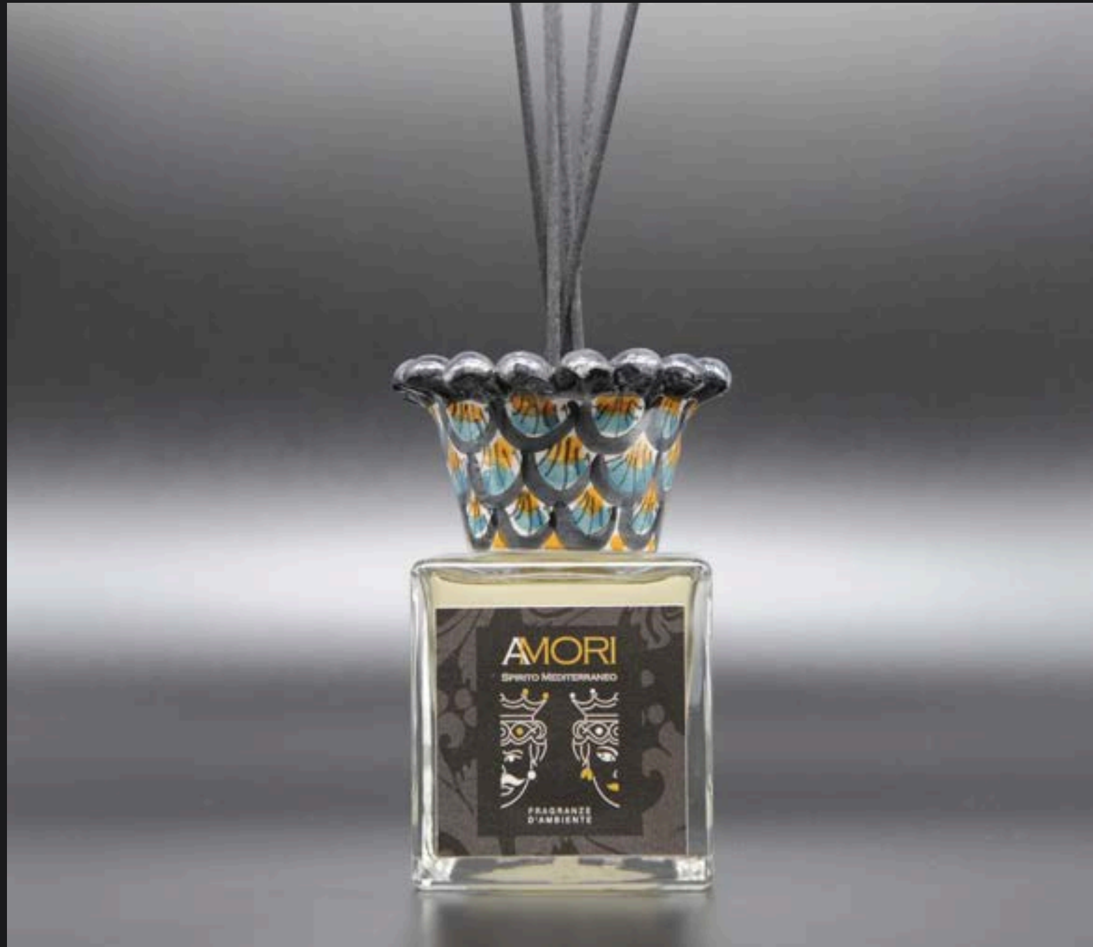
Flacone ml 200 Collare Corona